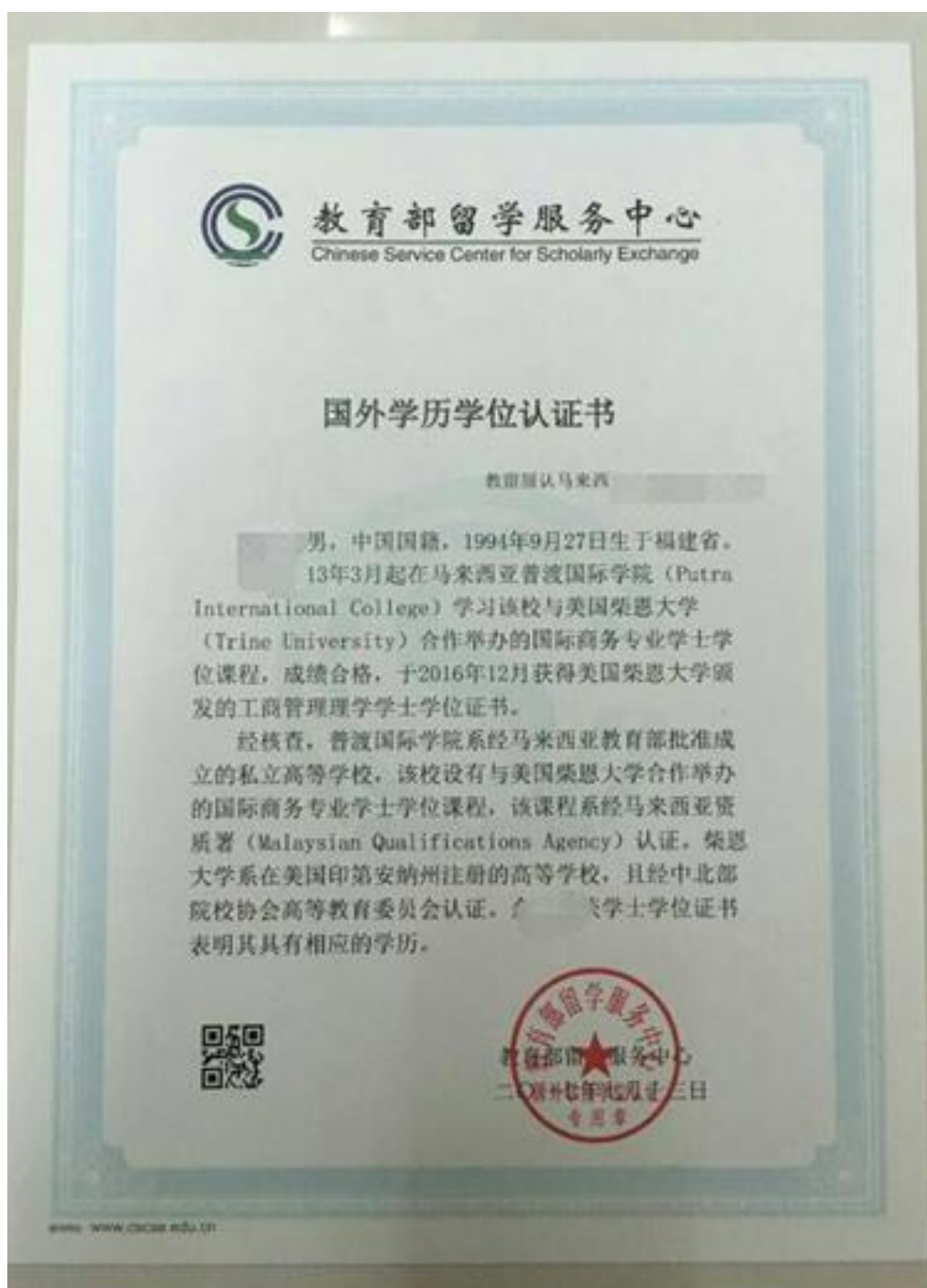
教育部留学服务中心出具的认证报告照片示例