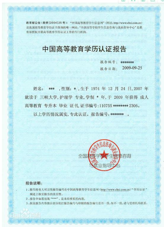
教育部学历认证报告照片示例